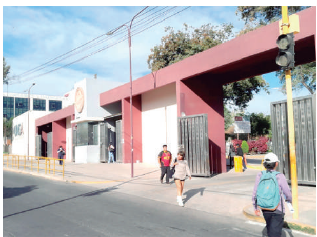
EL PRIMER CASO de sarampión se detectó en el área de Sociales de la UNSA.

protección adecuada contra la enfermedad. Ante ese escenario, las autoridades sanitarias recomendaron reforzar la vacunación infantil. Además, advirtieron que las actividades masivas y los desplazamientos recientes incrementan el riesgo de contagio a nivel local, por lo que recomendaron mantener medidas de prevención y monitoreo constante.