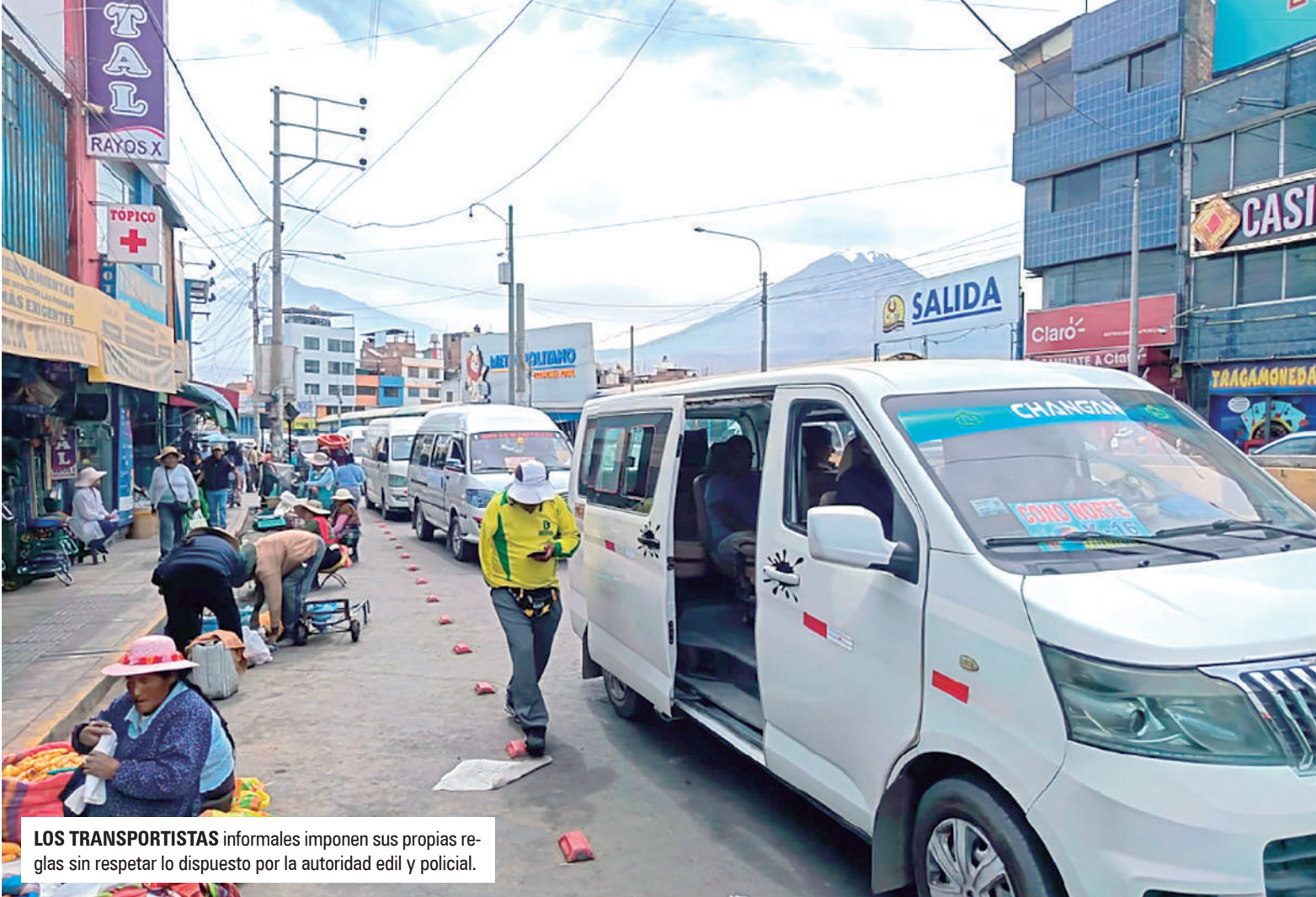
LOS TRANSPORTISTAS informales imponen sus propias reglas sin respetar lo dispuesto por la autoridad edil y policial.

El cambio de alcalde provincial dejó un vacío en el control del transporte informal. Las “loncheritas” ocupan paraderos informales como en la Av. Vidaurrazaga generando caos vehicular y riesgo para los pasajeros.