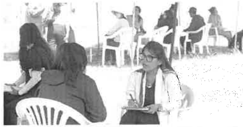
• EL ACOMPAÑAMIENTO de psicólogos en niños, adolescentes e incluso adultos, ayuda manejar las emociones.

Ante el deterioro de la salud mental en nuestra región, desde el centro de salud mental Moisés Heresi resaltaron la importancia de actuar preventivamente ante el incremento de patologías psicológicas. Por ello, subrayaron la necesidad de brindar apoyo psicológico de manera temprana, especialmente en la etapa escolar. Más aún, cuando actualmente hay pocos colegios que cuentan con un psicólogo para atender a la población escolar; inacción que podría estar causando el empobrecimiento de la salud mental en Arequipa.