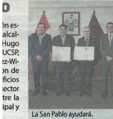
La San Pablo ayudará.