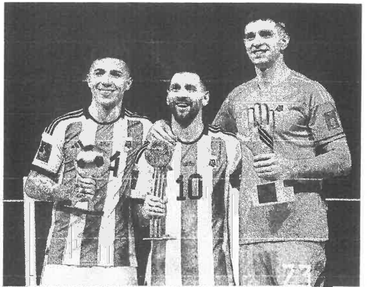
PREMIADOS. Fernández, Messi y Martínez recibieron trofeos al final por ser los mejores.

¿Argentina logró la clasificación directa? A partir de Corea-Japón 2002, los campeones de la Copa del Mundo ya no cuentan con la ventaja deportiva de clasificación directa a la siguiente edición. Esto quiere decir que la 'Albiceleste' deberá ganarse el derecho a disputar el Mundial 2026 como todas las demás selecciones. ♦