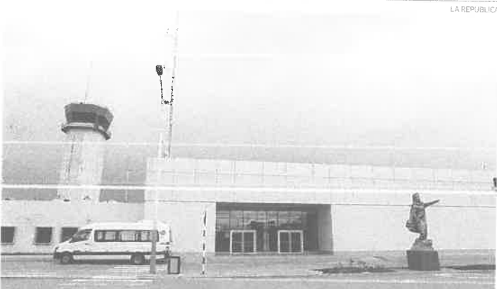
CERRADO. Aeropuerto de Juliaca recién será reabierto el 20 de junio, tras casi un mes de cierre.