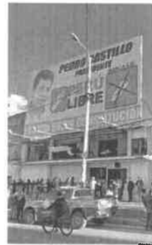
Cientos acudieron a actividad.

es el único hecho que le llamó la atención. Dijo que cuando realizan operativos contra el comercio ambulador reciben frases amenazadoras como: "cuando mi candidato gane, va a ver lo que le va a pasar a usted y a su gente", contó.