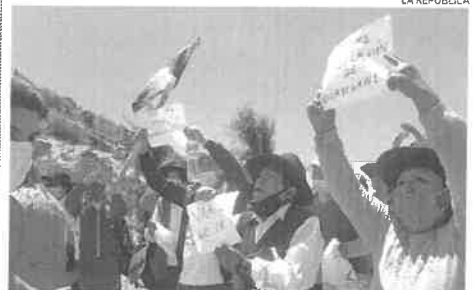
RECHAZO. Pobladores de Ticaco dicen "no" a proyecto hídrico Vilavilani.

Sagasti se retiró en su camioneta, y evitó el contacto con los manifestantes. ♦