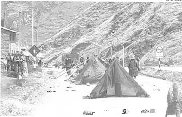
BLOQUEO. No hay paso de los camiones mineros de Las Bambas hacia el puerto de Matarani.