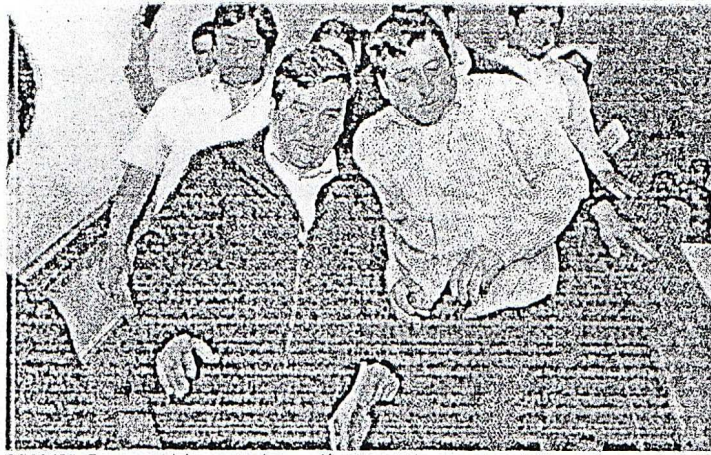
DEFENSA. En espera del recurso de casación que estaba en manos del juez César Hinostroza