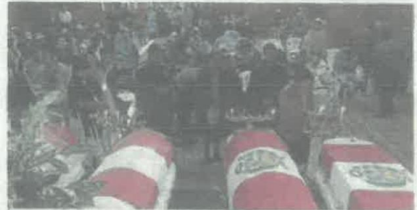
Cuerpos fueron velados en municipio de El Collao.