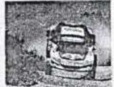
Tendrán mejor desempeño.

El equipo Peugeot Sport, campeón en las dos últimas ediciones del Rally Dakar, viene mejorando su modelo 3008DKR para poder afrontar el próximo Dakar que incluirá las difíciles dunas del desierto peruano. El 3008DKR Maxi es 20 centímetros más ancho que