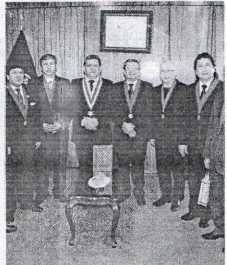
EVENTO. En Congreso participan presidentes de cortes.