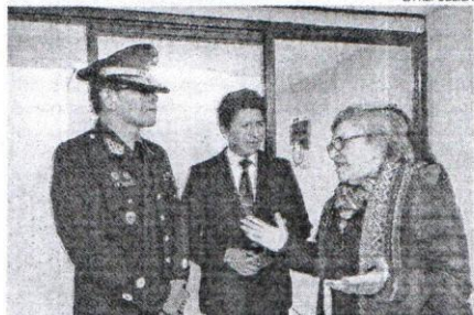
NOTOS. CEM atenderá denuncias de maltrato en comisaría.

La ministra de la Mujer y Poblaciones Vulnerables, María Romero, inauguró local que integra la Comisaría con el Centro de Emergencia Mujer (CEM) a fin de tener una adecuada atención o socorro a las mujeres víctimas de violencia física, sexual y psicológica. En Cusco, según cifras del Instituto Nacional de Estadística e Informática (INEI), el 75% de las mujeres entre los 15 y 49 años han sufrido alguna vez