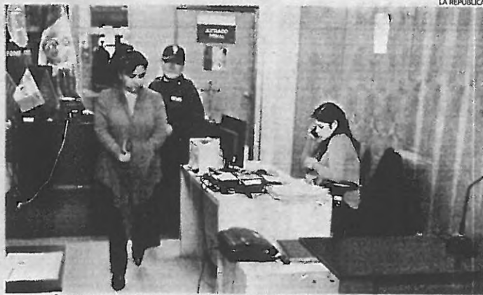
DETENCIÓN. Mujer adoptó como suyo al menor y lo hizo pasar como si fuera su hijo.